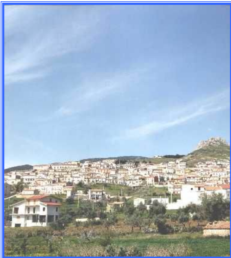
Figura 1 Francavilla Marittima Panorama

Le prime notizie in merito a rinvenimenti archeologici nell'area di Francavilla Marittima