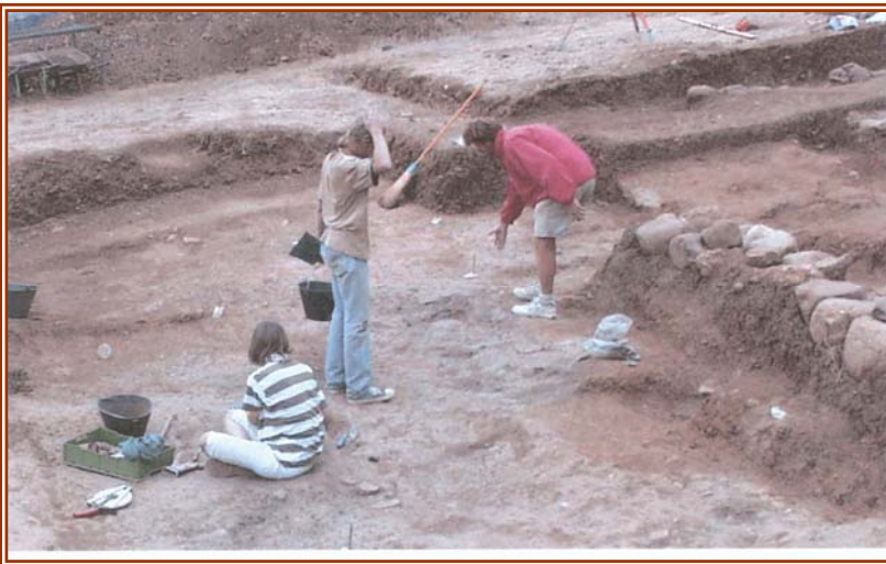
Figura 2 Studenti impegnati negli scavi

La Breve ripresa degli scavi da parte della soprintendenza archeologica della Calabria è servita anche a bloccare momentaneamente il fenomeno dei tombaroli clandestini.