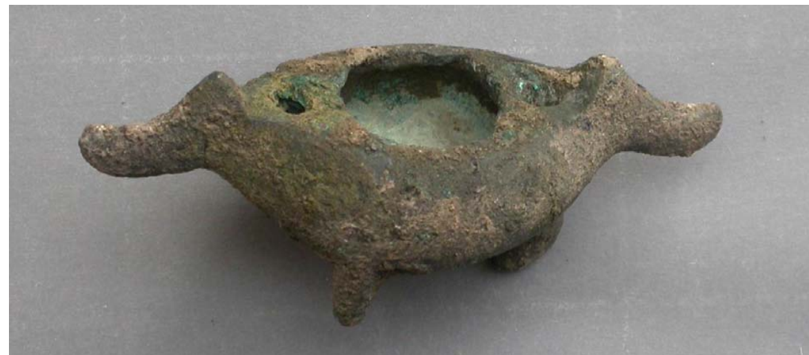
Lucerna in bronzo a forma di Barca con tripodi