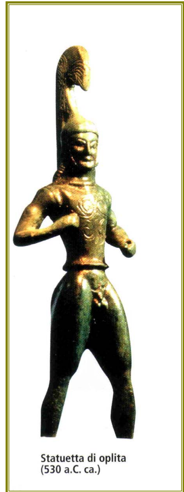
Statuetta di oplita (530 a.C. ca.)