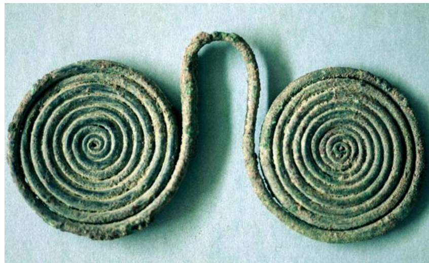
Pendagli a forma di occhiali