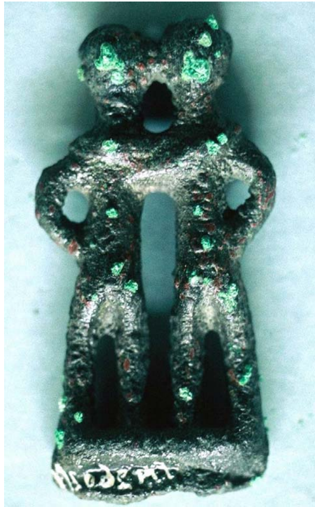
UOMO E DONNA IN BRONZO